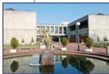
金城大学短期大学部 [笠間キャンパス]