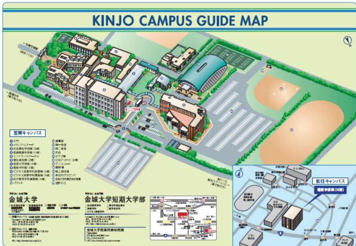
<図 2-9-2 : KINJO CAMPUS GUIDE MAP>