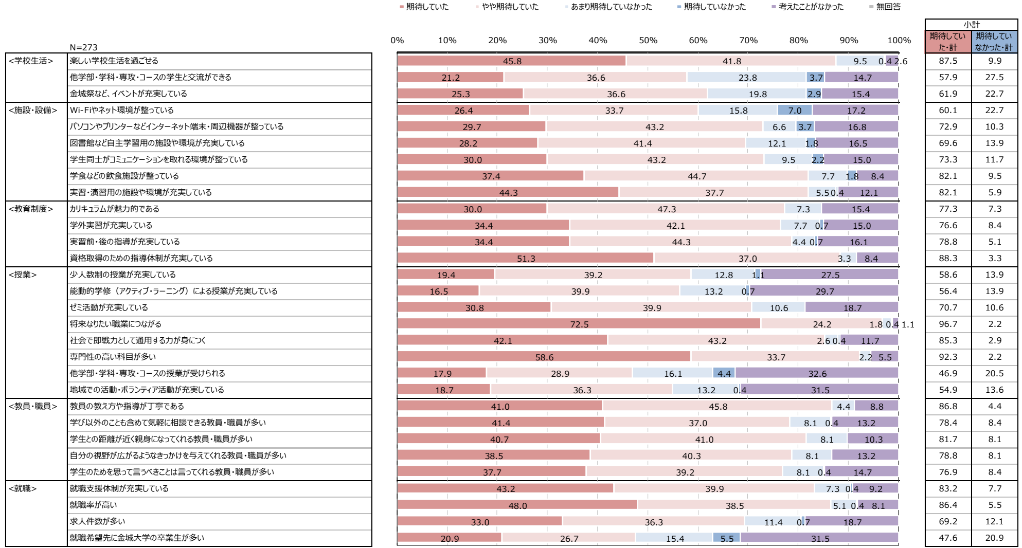
令和3年度 回答者全体値比較